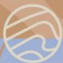
Tabela de Preço